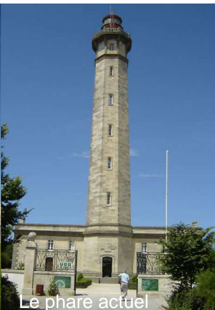
Le phare actuel