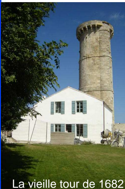
La vieille tour de 1682