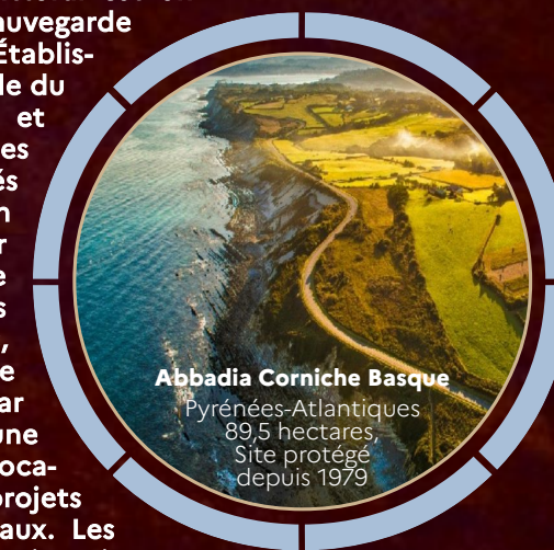
Abbadia Corniche Basque Pyrénées-Atlantiques 89,5 hectares Site protégé depuis 1979

Créé en 1975, le Conservatoire du littoral est un opérateur foncier au service de la sauvegarde de l'espace littoral et lacustre. Établissement public de l'État, placé sous la tutelle du Ministère de la Transition écologique et solidaire, son intervention porte sur les espaces littoraux remarquables ou menacés afin qu'ils bénéficient d'une protection définitive. Ces lieux se distinguent par leur faune, leur flore, leur histoire, leur paysage ou leurs activités. Ces terrains singuliers acquis par le Conservatoire sont protégés, restaurés et aménagés pour permettre une ouverture au public. Les terrains acquis par le Conservatoire du littoral sont d'une grande diversité et ils ont différentes vocations qui nécessitent la mise en place de projets spécifiques, en lien avec les acteurs locaux. Les enjeux sont multiples : écologiques, patrimoniaux, agricoles, touristiques et culturels.