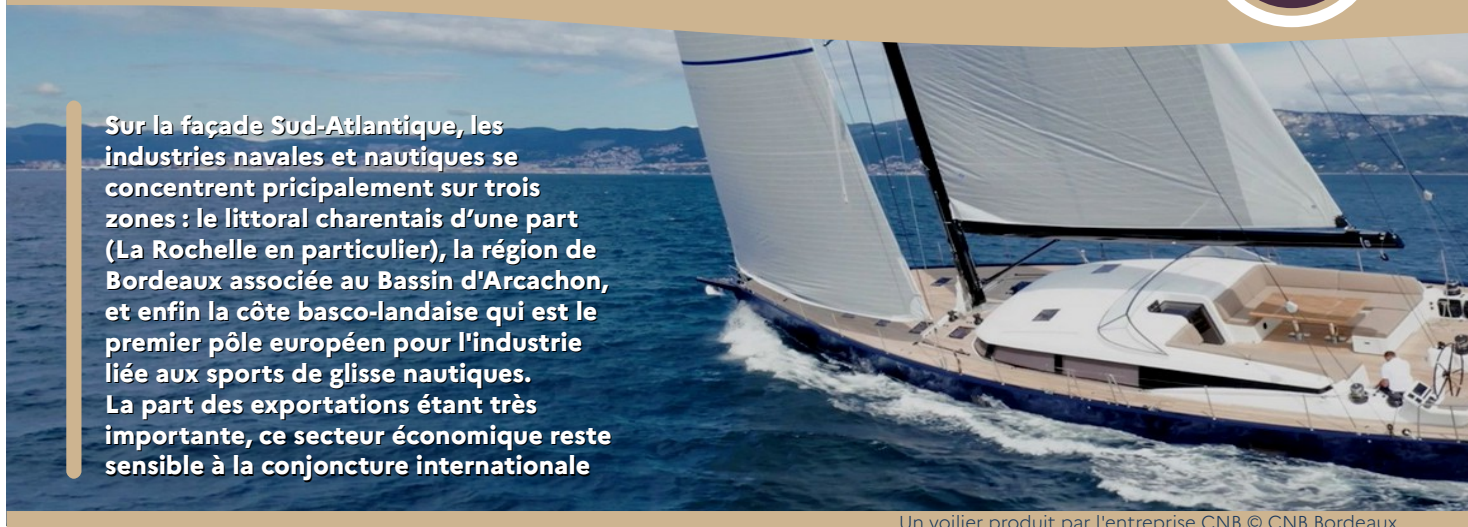
Un voilier produit par l'entreprise CNB

Sur la façade Sud-Atlantique, les industries navales et nautiques se concentrent principalement sur trois zones : le littoral charentais d'une part (La Rochelle en particulier), la région de Bordeaux associée au Bassin d'Arcachon, et enfin la côte basco-landaise qui est le premier pôle européen pour l'industrie liée aux sports de glisse nautiques. La part des exportations étant très importante, ce secteur économique reste sensible à la conjoncture internationale