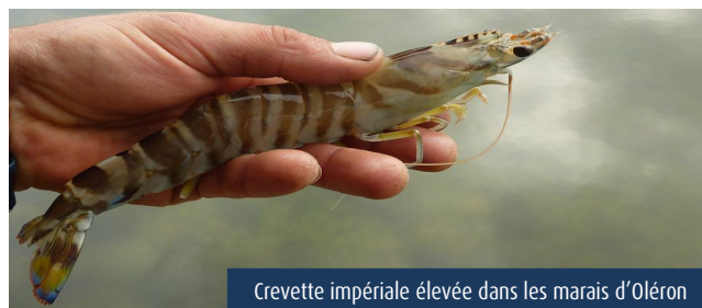
Crevette impériale élevée dans les marais d'Oléron

Pour la région Nouvelle-Aquitaine, ces activités de production concernent la pisciculture c'est-à-dire l'élevage des poissons marins et plus spécifiquement le turbot et la daurade ainsi que la pénéculture, c'est-à-dire l'élevage des crevettes. Ces activités sont caractérisées par la mise en place de technologies de plus en plus performantes et peuvent s'appuyer sur les résultats d'études scientifiques visant à améliorer la croissance, la résistance ou la mise en marché de ces produits mais également dans un objectif de développement et d'acclimatation de nouvelles espèces.