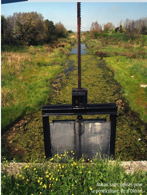
Marais salés utilisés pour la pénéculture, Ile d'Oléron

En complément de son activité majeure de production conchylicole, d'autres productions aquacoles de la façade Sud-Atlantique, certes moins développées, méritent d'être abordées en raison de leurs spécificités et de leurs synergies.