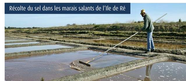
Récolte du sel dans les marais salants de l'île de Ré

Même si elle ne peut être considérée comme une activité aquacole, la culture du sel est emblématique du patrimoine de Charente-Maritime, et les marais salants sont indissociables du paysage charentais. C'est une activité préservée sur l'île de Ré où l'on compte une trentaine de sauniers voués à la préservation du marais salant. Les marais salants de l'île d'Oléron et de la commune de Mornac-sur-Seudre sont d'autres lieux emblématiques de la culture du sel.