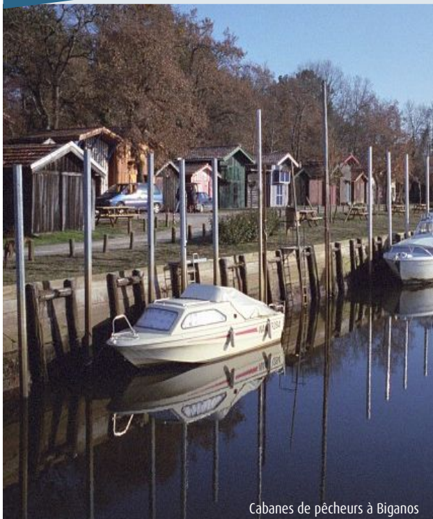
Cabanes de pêcheurs à Biganos