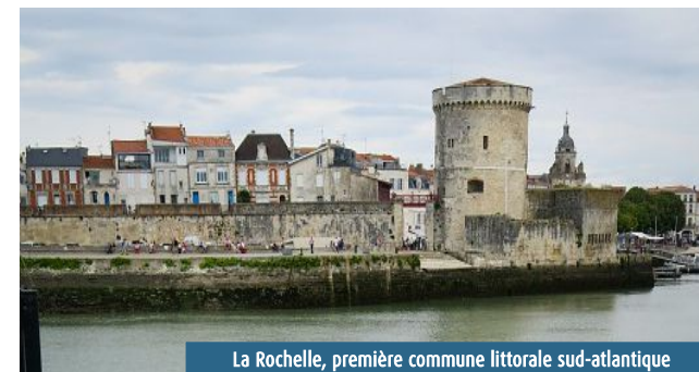
La Rochelle, première commune littorale sud-atlantique

La façade Sud Atlantique couvre près d'un cinquième de la surface totale des communes littorales (18,5 %). Les communes y sont, en moyenne, nettement plus grandes que la moyenne littorale : près de 4.000 ha contre 2.440 ha, soit environ 60 % de plus. La surface des communes est variable d'un département à l'autre. Elle est plutôt faible en Charente-Maritime (1.701 ha) et dans les Pyrénées-Atlantiques (1.714 ha), forte dans les Landes (5.978 ha) et particulièrement élevée en Gironde (9.080 ha).