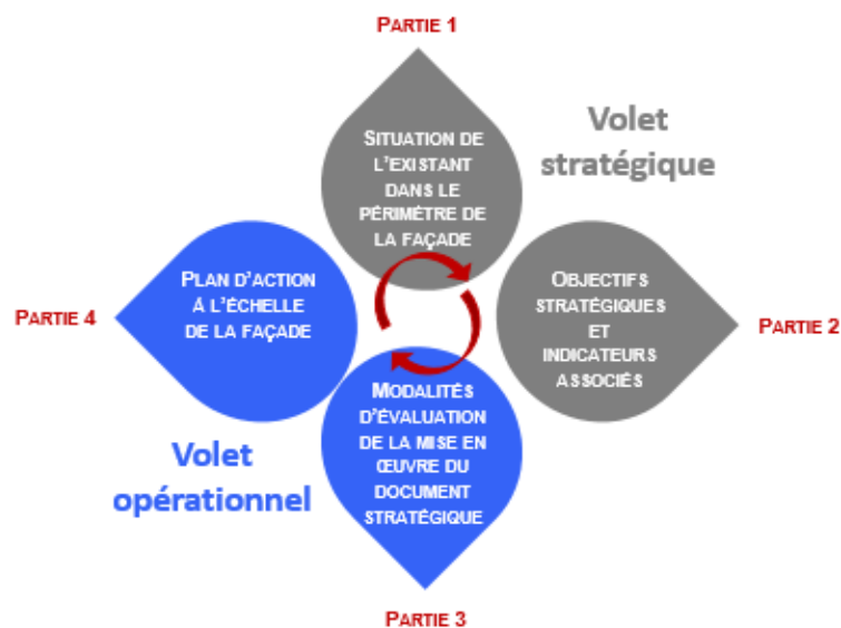
Figure 1-Présentation du DSF

Le document stratégique de façade comprend quatre parties (schéma ci-dessous), chacune d'elle a vocation à être enrichie et amendée au vu de l'amélioration des connaissances disponibles. Elles seront actualisées dans les révisions du document, prévues tous les six ans.