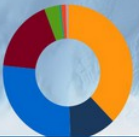
PYRENEES-ATLANTIQUES 594 éducateurs sportifs