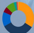
GIRONDE 579 éducateurs sportifs