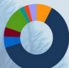
CHARENTE-MARITIME 576 éducateurs sportifs